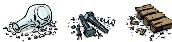
6. Réduction des risques liés aux corps étrangers