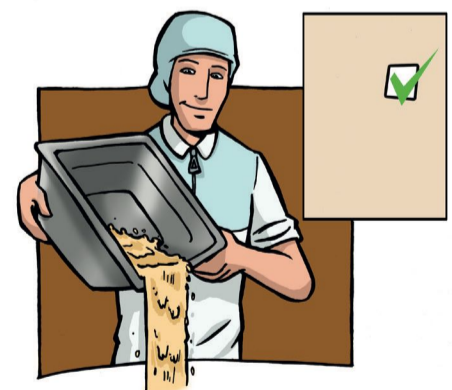
5. Conformité des produits et des recettes