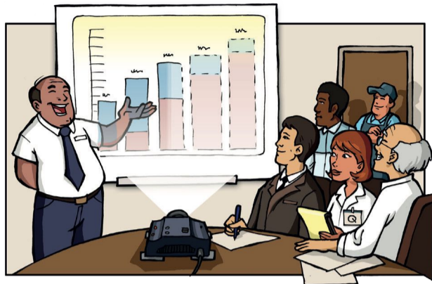
1. Gouvernance et engagement