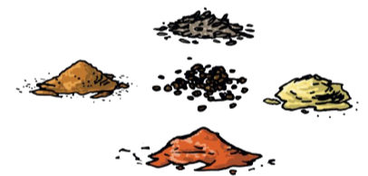
4. Spécifications des matières premières