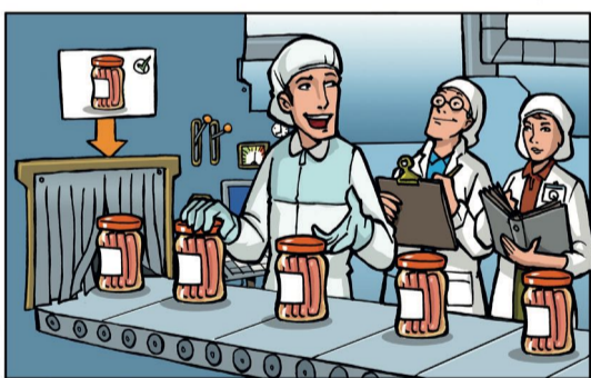
8. Audits internes