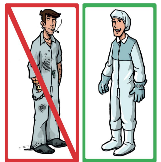
3. Hygiène personnelle