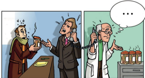
9. Procédure de retrait/rappel de produits