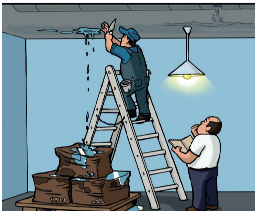
10. Actions correctives